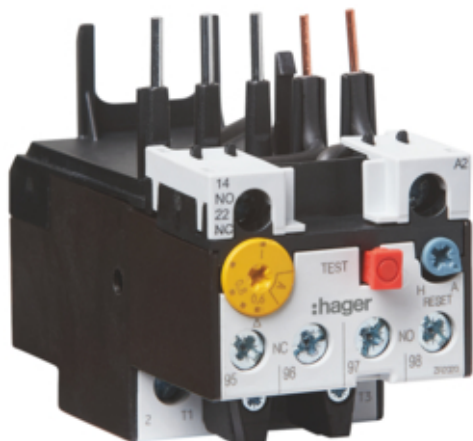
Реле теплове до контакторі в EV007...EV015, 1НВ+1НЗ, 1.0-1.6А

Подібне зображення (Показ зображень EVBOXXA)